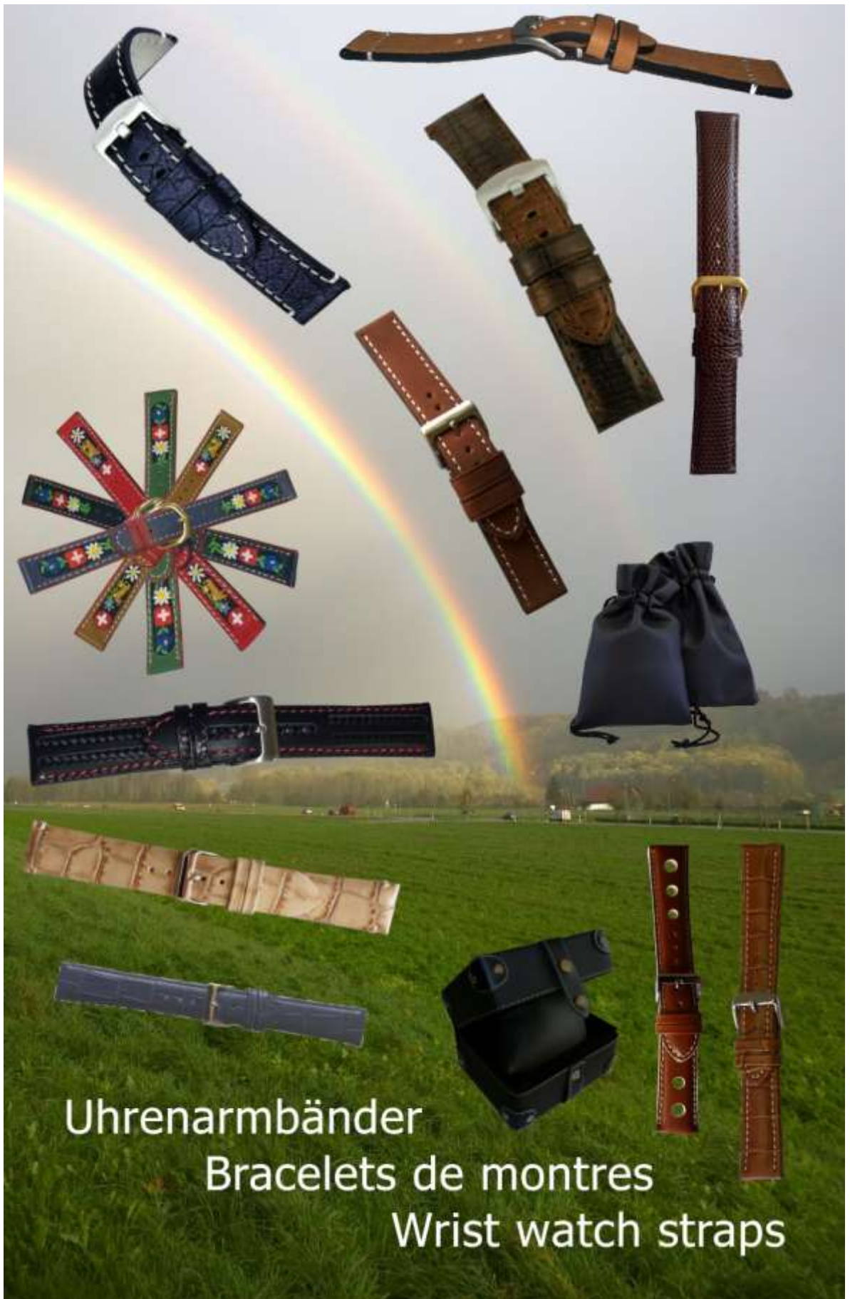
Uhrenarmbänder Bracelets de montres Wrist watch straps